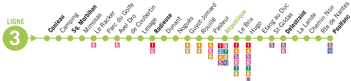
UN BUS TOUTES LES 20 MIN